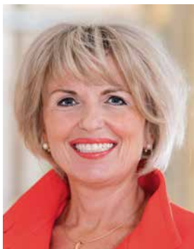
Tamara BISCHOF (Freie Wähler) Fraktionsvorsitzende