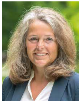
Christina FEILER (Bündnis 90/Die Grünen)