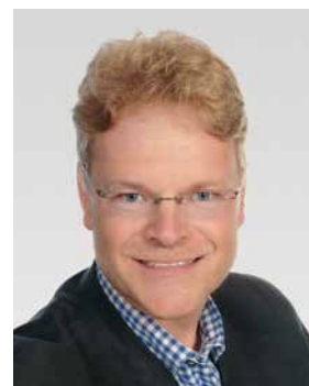
Alfred SCHMITT (AfD)