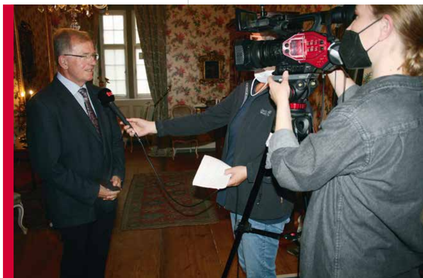
Das neu gestaltete Graf-Luxburg-Museum stößt auf großes Medien-Interesse.

Schloss Aschach geht auf eine mittelalterliche Burg zurück, die von den Grafen von Henneberg im 12. Jahrhundert errichtet worden war. Im 16. Jahrhundert wurde die Anlage mehrfach zerstört und von den Würzburger Fürstbischöfen wiederaufgebaut, die den Bau als Jagdschloss und Verwaltungssitz nutzten. 1874 kaufte die gräfliche Familie von Luxburg das Schloss als Sommerresidenz. 1955 kam es mit seiner kompletten Ausstattung und den wertvollen Sammlungen als Schenkung in das Eigentum des Bezirk Unterfranken.