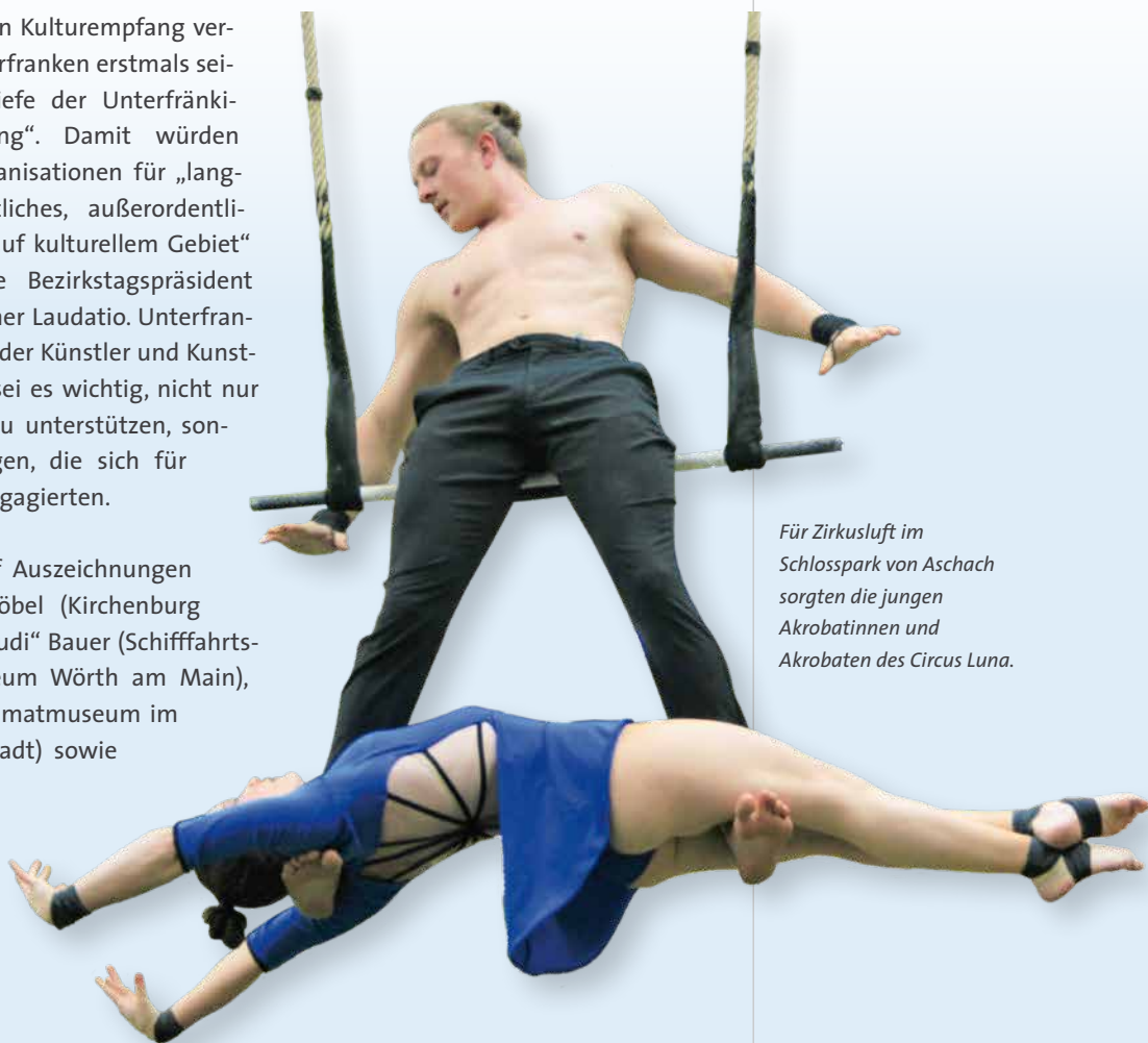
Für Zirkusluft im Schlosspark von Aschach sorgten die jungen Akrobatinnen und Akrobaten des Circus Luna.