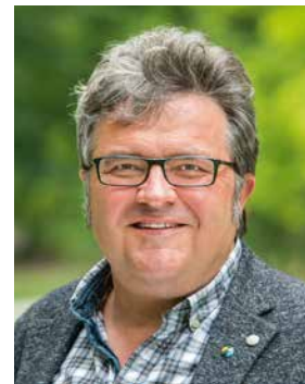
Gerhard MÜLLER (Bündnis 90/Die Grünen)