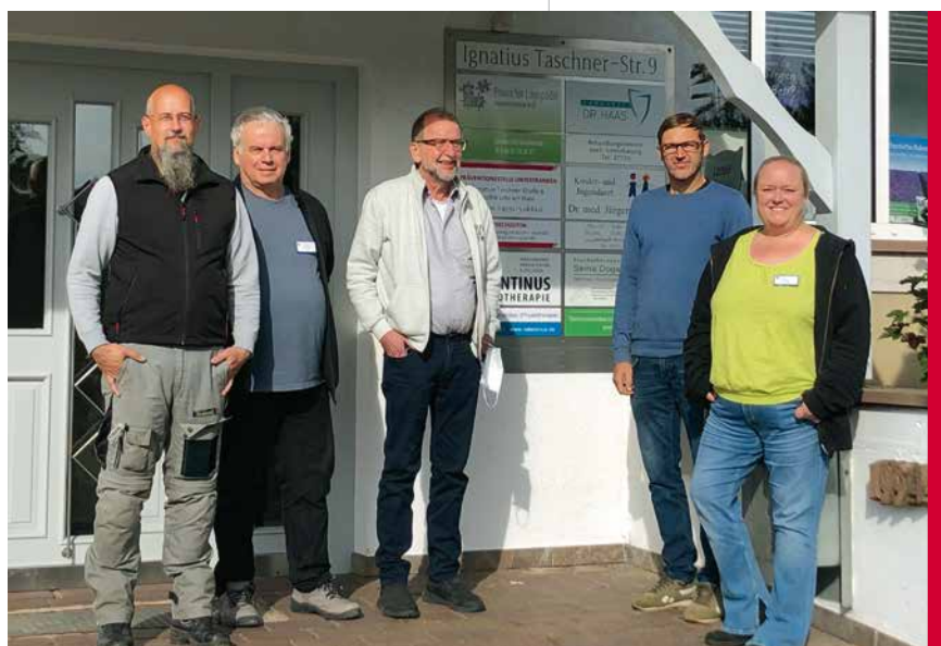
Kompetente Hilfe für eventuell gewaltbereite Patientinnen und Patienten: Das Team der Präventionsstelle Unterfranken.