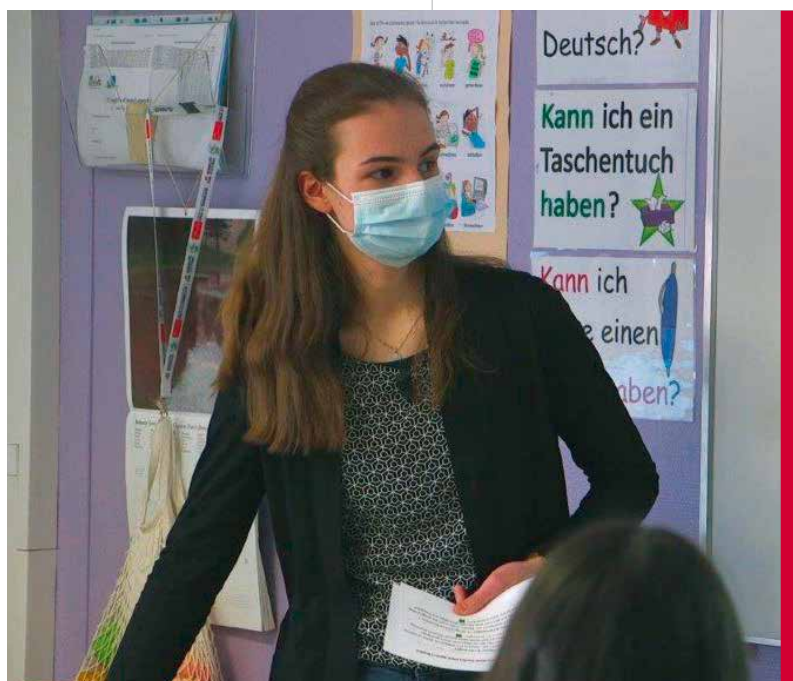
Zu den Aufgaben einer Deutsch-Französischen Freiwilligen gehört es auch, in französischen Schulklassen über Europa und Deutschland zu erzählen.