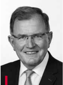
BEZIRKSTAGS- PRÄSIDENT Erwin Dotzel Wörth am Main