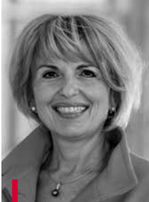
FRAKTIONS- VORSITZENDE Tamara Bischof Dettelbach